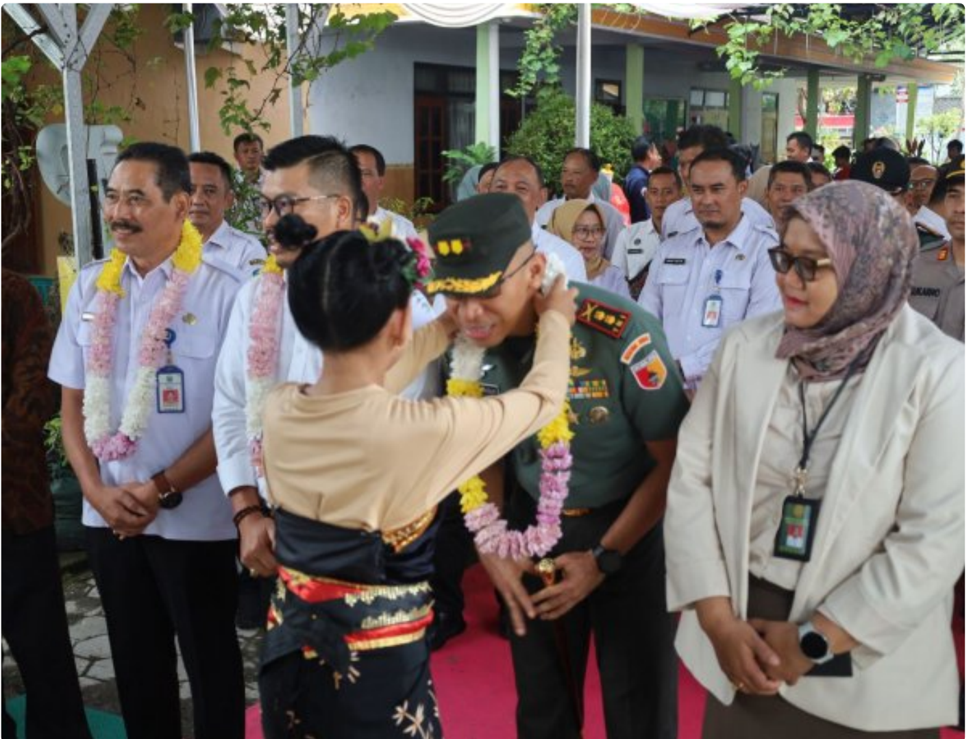
Dukung Program Pemerintah, Dandim 0804/Magetan Hadiri Musrenbang Tingkat Kecamatan