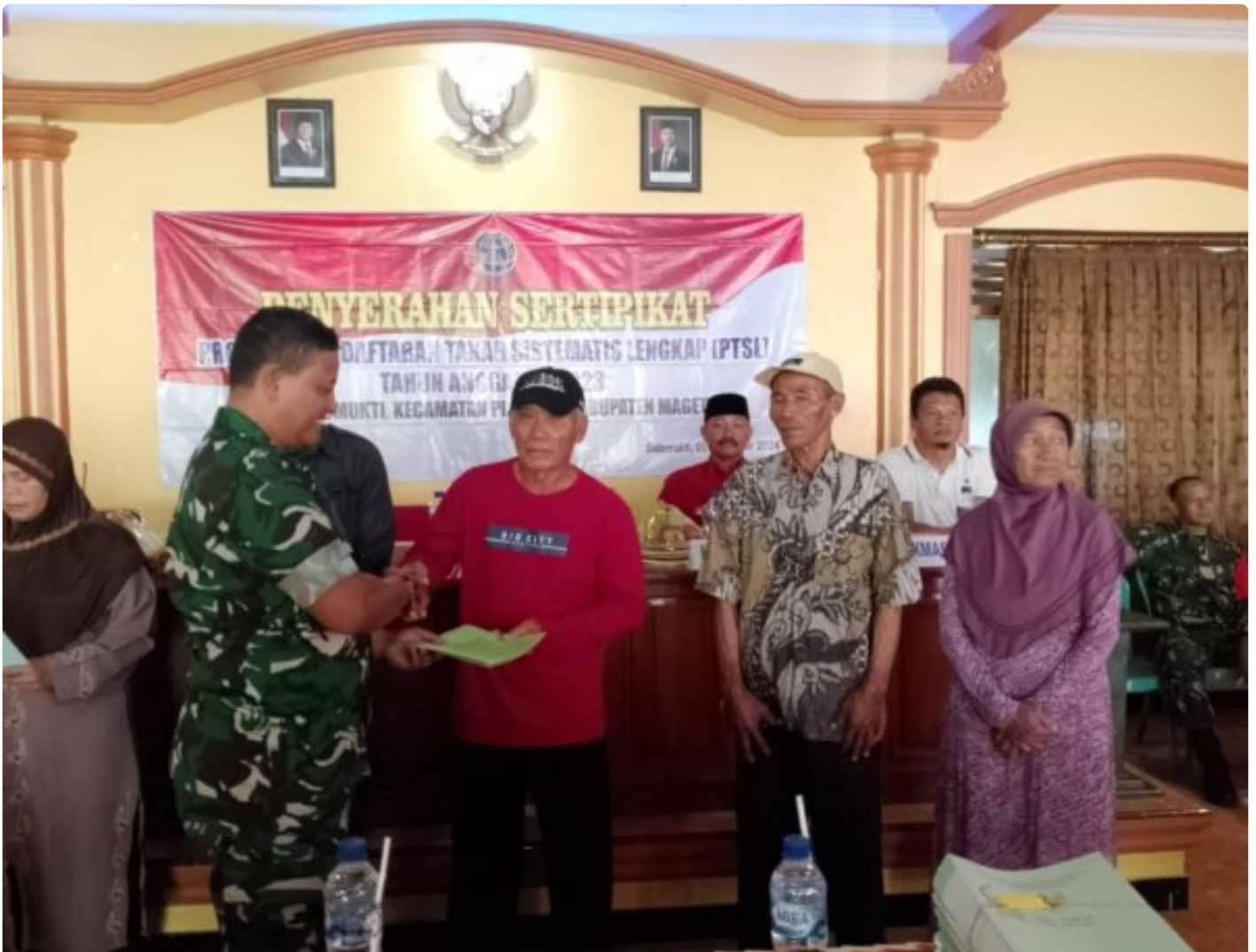
Danramil 0804/02 Plaosan Hadiri Penyerahan Sertifikat Program Pendaftaran Tanah Sistematis Lengkap (PTSL) Desa Sidomukti

PLAOSAN. - Desa Sidomukti melalui Badan Pertanahan Nasional (BPN) melakukan penyerahan Sertifikat Tanah Program Pendaftaran Tanah Sistematis